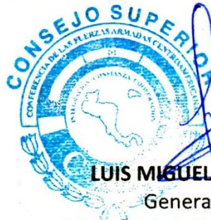
LUIS MIGUEL RALDA MORENO General de División Ministro de la Defensa Nacional de la República de Guatemala y Miembro del Consejo Superior de la CFAC