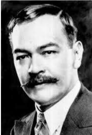
Dr. Vicente Mejía Colindres

Nuestra Fuerza Aérea se remonta a los años de 1929 a 1933 durante la administración del Dr. Vicente Mejía Colindres, en donde se crea el Despacho de Aviación anexo a la Secretaria de Guerra, Marina y Aviación preliminarmente el 8 de abril de 1930 el Congreso Nacional mediante decreto N° 217, asimismo aprueba la primera ley de Aeronáutica. El 14 de abril de 1931 se sanciona el decreto N° 198 que da vida institucional a la Escuela Nacional de Aviación.