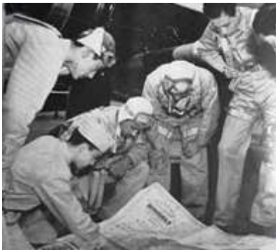
Pilotos hondureños preparando los patrullajes del día.

El Gobierno del Presidente Tiburcio Carías Andino declaró la guerra a Japón el 8 de diciembre de 1941, a Italia y Alemania cuatro días después, por presiones del Gobierno de los Estados Unidos a través de un pacto de alianza militar establecido con dicha nación.