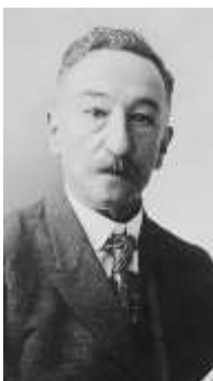
General Rafael López Gutiérrez

El Estado de Honduras, bajo la administración del General Rafael López Gutiérrez, adquiere el primer avión militar, tipo Bristol F.2B Fighter, fabricado por la compañía inglesa, British & colonial Aeroplane Co. LTD. Diseñado por Frank S. Barnwell, sus modelos fueron utilizados con gran desempeño en operaciones bélicas en la I Guerra Mundial, contaba con modificaciones en el motor y su radiador de forma cuadrada instalado en la nariz.